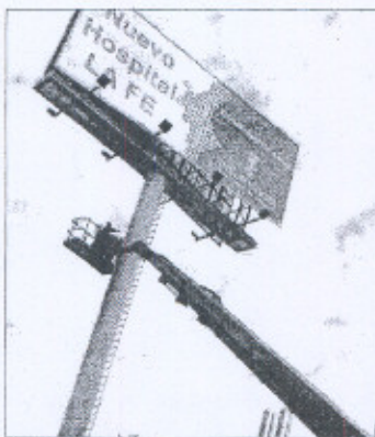
Un obrero pinta el poste, el jueves.